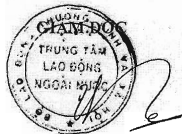
Hà Xuân Tùng